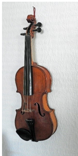
Violin bygget af Hans Alfred Thomsen